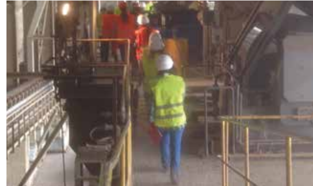
Zementfabrik VIGIER CEMENT AG