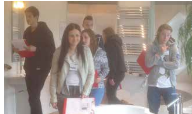
Besuch Ausstellung «Bäder und Plättli»