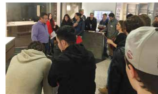
ük4: Besuch Sanitär- und Plattenausstellung