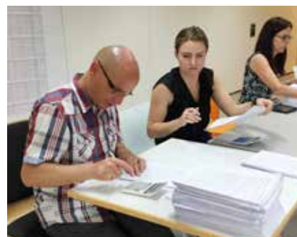
Korrektur schriftliche Prüfungen