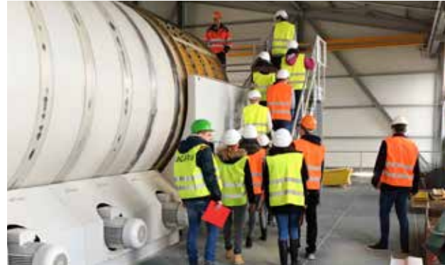
ük 4: Besuch Betonwerk