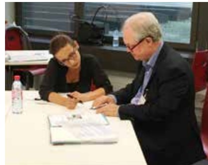
Besprechung Protokoll nach einer mündlichen Prüfung