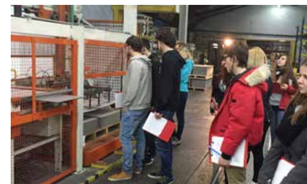
ük4: Besuch Produktionsbetrieb