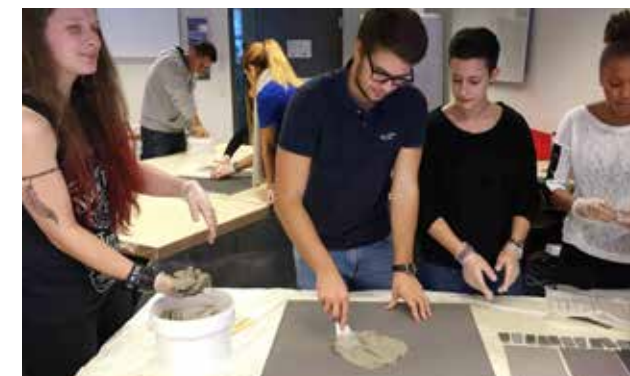
ük 5 Plättli legen

Der ebenfalls zweitägige und letzte üK 6 stand ganz im Zeichen der Lehrabschlussprüfung. Die Lernenden übten sowohl das Fachgespräch als auch das Rollenspiel. Ein weiterer Schwerpunkt des üK 6 war die Repetition des üK-Stoffes. Hierzu erhielten alle Lernenden ein vorgedrucktes Kartenset mit den wichtigsten Inhalten aus allen Kursen. Die Karten wurden – versehen und ergänzt mit eigenen Bemerkungen der Lernenden – auf grosse Plakate aufgebracht und in einen kaufmännischen Zusammenhang gestellt. Der Hausbau wurde unter anderem mit dem Einbau einer Küche abgeschlossen. Am Ende erfolgten die Fertigstellung der Umgebungsarbeiten und die Durchführung der Reinigungsarbeiten. Anhand der Übergabe des Werks an die Bauherrschaft inkl. Mängelliste wurden die Themen Mängelbehebung, Umwandlung des Baukredits in eine Hypothek und Bauhandwerkerpfandrecht behandelt. Mit einer symbolischen Schlüsselübergabe, bei der auch Salz und Brot verteilt wurde, entliessen die üK-Leitenden die Lernenden in die Berufswelt.