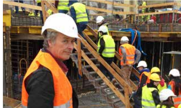
ük4: Besuch Baustelle