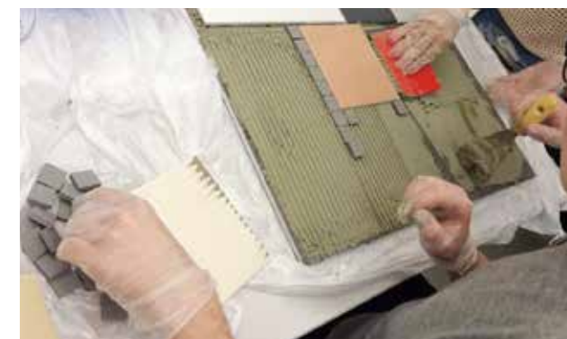
ük 5 Plättli legen