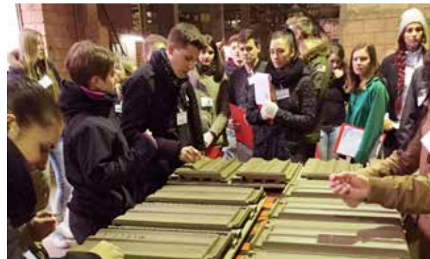
ük 4: Besuch Ziegelei