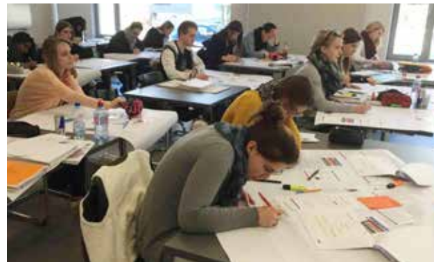
ük 6: Roadmap